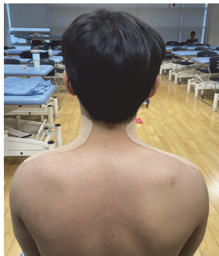
Fig. 2. Elastic taping.