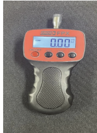
Fig. 2. Digital pressure algometer.

압력통증역치의 측정은 Digital algometer pressure FPX25 (Wagner Instruments, Connecticut, USA)를 사용하였으며(Fig. 2), 측정 부위는 허리뼈 1번(L1), 허리뼈 3번(L3), 허리뼈 5번(L5) 수준의 척추주위근(paraspinal muscle bellies)이다[16](Fig. 3). 스마트폰 사용 유무에 따른 각각의 자세에서 검사자는 통각계를 이용하여 대상자의 해당 부위에 압력을 가하여 압력감각이 통증으로 변하는 시점에 “지금”이라는 말을 하도록 교육하였으며, 말을 하는 순간 압력을 제거하여 그 시점의 수치를 기록하였다.