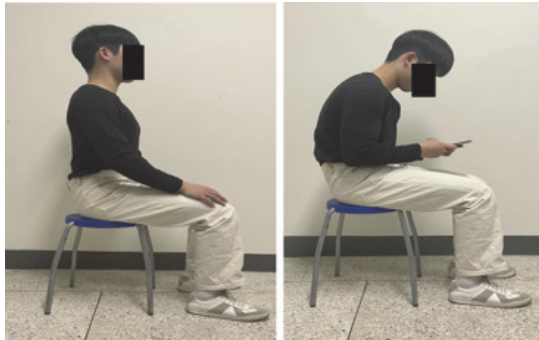
Fig. 1. Sitting posture without a smartphone and while using a smartphone.

트폰을 사용하지 않는 일반적인 자세는 등받이와 팔걸이가 없는 의자에 앉아 엉덩관절과 무릎관절을 각각 90도로 설정하였으며, 발목관절은 무릎관절과 수직선 상에 놓이도록 하여 시선은 정면을 바라보도록 하였다 [15]. 그리고 스마트폰을 사용하는 자세는 등받이와 팔걸이가 없는 의자에 앉아 엉덩관절과 무릎관절을 90도로 설정하고, 발목관절은 무릎관절과 수직선 상에 놓이도록 하였으며, 팔꿈관절을 90도로 하여 iPhone 12 스마트폰을 양손에 쥐고 5분 동안 재미있는 영상을 시청하게 하였다(Fig. 1). 스마트폰을 사용하기 전의 자세에서 측정을 먼저 시행하였으며, 대상자는 매 측정 마다 10분 이상의 충분한 휴식을 취할 수 있도록 한 다음에 스마트폰 사용 자세에서 측정을 진행하였다.