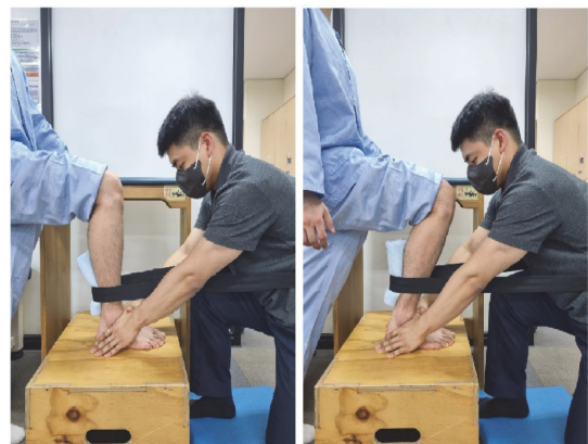
Fig. 1. Paralyzed ankle joint mobilization based on the active movement of the stroke patient.

실험군에 배정된 대상자들에게 적용한 발목관절가동술은 15분간 적용하였다. 발목관절가동술은 전신진동운동 시행 전에 실시하였다. 모든 대상자는 선 자세에서 마비측 하지를 높이 30 cm의 원목으로 만들어진 의자에 위치하도록 한 후 능동적으로 무릎을 굽혀 체중을 마비측 하지로 이동시키도록 하였다. 치료사는 대상자에게 발등을 굽힘 하도록 지시하였고, 동시에 대상자의 목발뼈를 고정된 후 치료용 벨트를 먼쪽경강뼈 부위에 걸치고 뒤에서 앞으로 활주 시켰다. 관절 가동성 향상을 위해 활주는 관절 가동범위의 중간범위에서 시작하여 끝 범위까지 가장 큰 진폭으로 3단계(grade III)의 강도를 적용하였다(Maitland, 1991). 발목관절가동술을 수행하는 동안 대상자의 비마비측에 높이 1 m의 지지대를 배치하여 대상자가 안정적으로 동작을 수행할 수 있도록 하였다. 발목관절가동술의 적용은 대상자가 전방으로 체중을 이동하여 10초 동안 유지하도록 한 후, 시작 자세로 돌아가서 5초 동안 휴식을 취하는 것을 1회로, 10회 반복을 한 세트로 적용하여, 총 6세트를 반복적으로 실시하였다[16](Fig. 1)