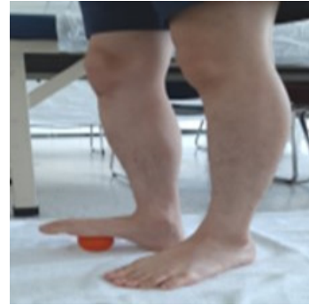
Fig. 2. Self-myofascial release of the sole.

대상자는 벽 앞에 선 다음, 어깨높이에서 팔꿈치를 편 채 평평한 벽을 향해 두 팔을 뻗고, 손바닥을 벽에댄다. 신장하고자 하는 부위의 다리를 뒤에 위치시키고, 반대쪽 다리는 신장하고자 하는 발의 앞에 위치시켜 무릎을 구부리는 자세를 취하였다. 중립적인 발 위치 유지를 위해 두 번째 발가락과 발꿈치 중앙을 하나의