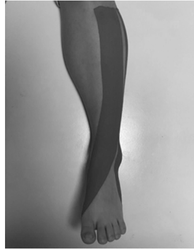
Fig. 2. Muscle control taping.