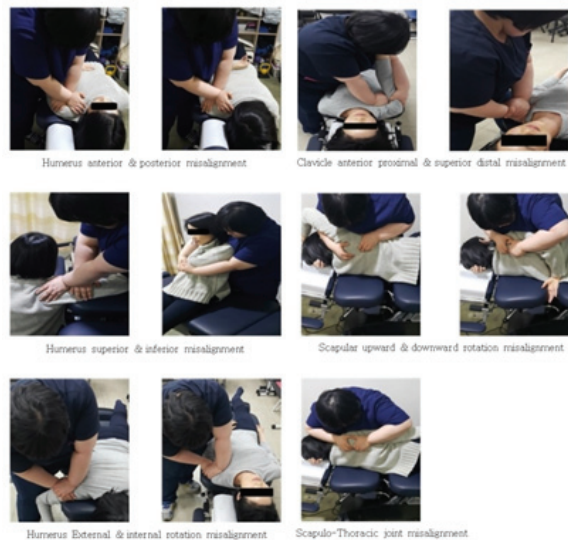
Fig. 2. Functional adjustment procedure therapy of the shoulder complex.