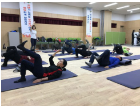
Fig. 1. Bridge position training.