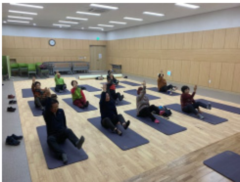
Fig. 2. Sitting position training.

이 중재를 적용하였다. 준비운동은 스프린터(Sprinter)와 스케이터(Skater) 패턴 구성요소를 몸으로 익히기 위해 선 자세에서 각각 5분씩 능동적으로 시행하였다. 협응이동훈련은 교각자세(Fig. 1), 다리 뻗고 앉은 자세(Fig. 2), 선 자세(Fig. 3)에서 스프린터 동작과 스케이터 동작을 한 세트당 10회로 하여 각 패턴에서 약 20여분간