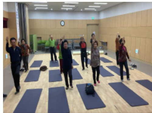
Fig. 3. Standing position training.